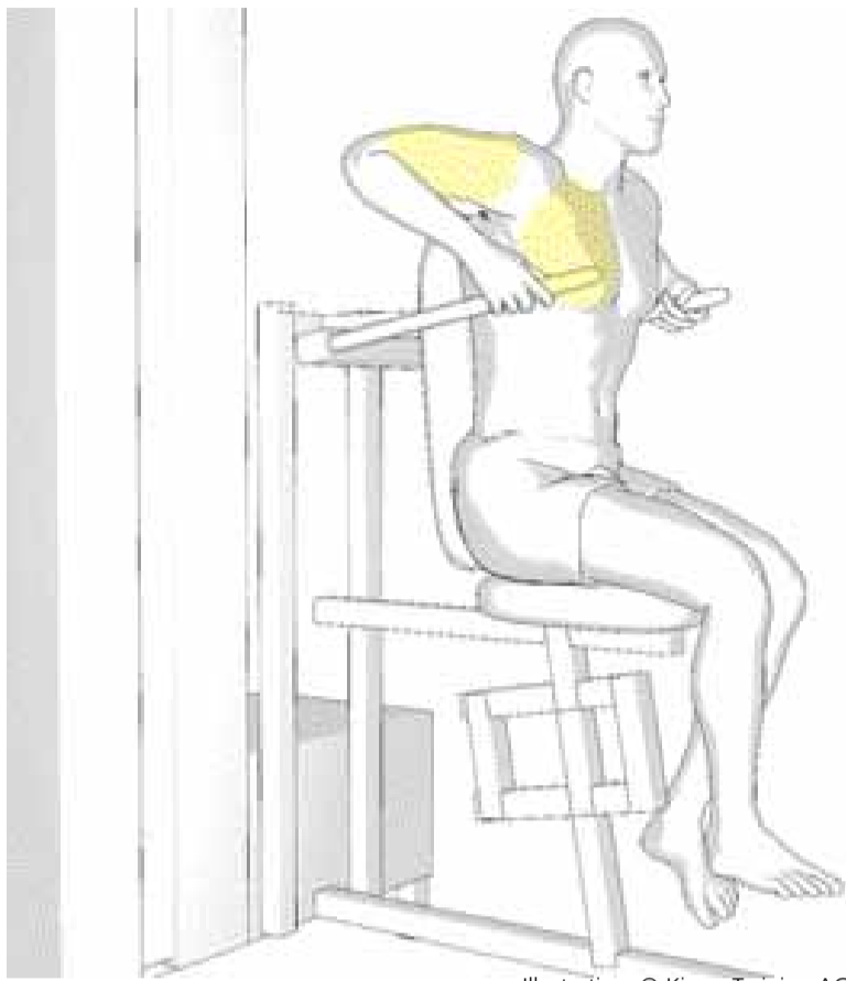
Illustration: © Kieser Training AG

Die D7 – der Barrenstütz sitzend – ist eine Übung, bei der Sie kaum darauf achten müssen, einzelne Muskeln zu isolieren. Schließlich ist fast die gesamte Arm- und Rumpfmuskulatur in die Bewegung involviert: Brustmuskulatur, Trapezmuskel und Trizeps. Gleichzeitig mobilisieren Sie den gesamten Schultergürtel. Damit sich Ihre Anstrengung lohnt, ist es wichtig, dass Sie Ihren Rumpf stabil halten und den Kopf geradeaus richten. Je aufrechter Sie sitzen, desto mehr muss Ihr Trizeps leisten. Eine leichte Vorneigung und nach außen gestellte Ellbogen lassen dahingegen die Brustmuskeln tüchtig arbeiten. Nachdem Ihre Arme das Gewicht nach unten weggedrückt haben – die Ellbogen werden dabei nicht voll gestreckt – ziehen Sie aktiv Ihre Schultern nach unten. Derart gestärkt, können Ihre Arme Sie wieder optimal stützen. Wohltuend und entlastend ist übrigens die «Traktionswirkung» – bei der Übung werden die Lendenwirbel minimal voneinander entfernt, was dem wohlbekannten «Aushängen» ähnelt.