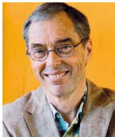
Prof. Dr. Schulz von Thun Kommunikationspsychologe

Wir haben in Deutschland die Monarchie aus guten Gründen abgeschafft. Anbieter und Kunde begegnen sich als Partner, sie vereinbaren eine Kooperation mit der Aussicht, dass beide davon profitieren. Die Begegnung findet auf Augenhöhe statt. Gewiss hat der Kunde Anspruch darauf, achtsam, respektvoll und sorgfältig bedient zu werden. Aber auch der Anbieter hat den Anspruch auf einen respektvollen Umgang, eine